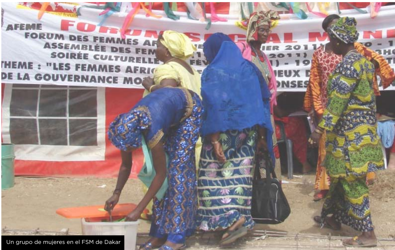
Un grupo de mujeres en el FSM de Dakar